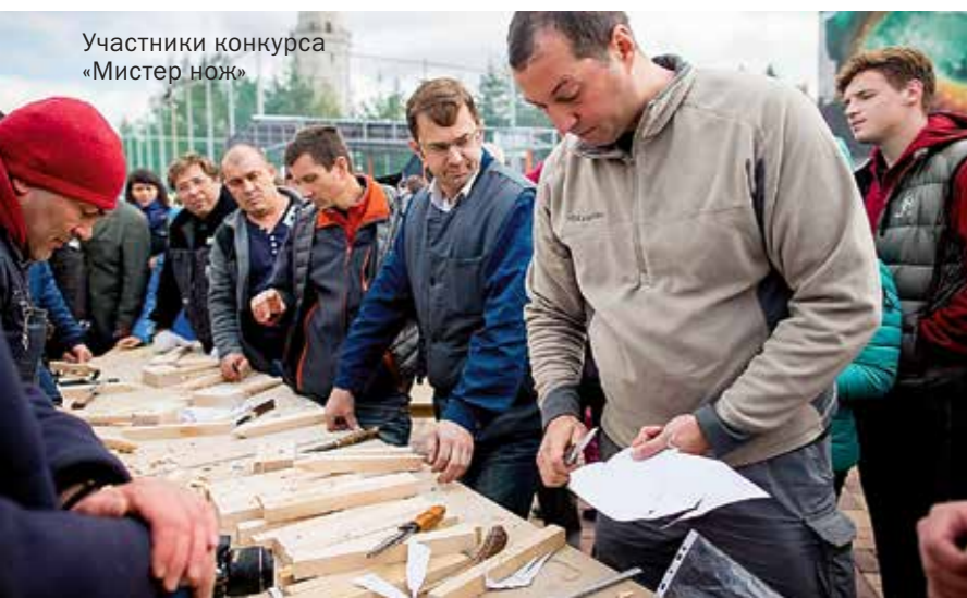
Участники конкурса «Мистер нож»