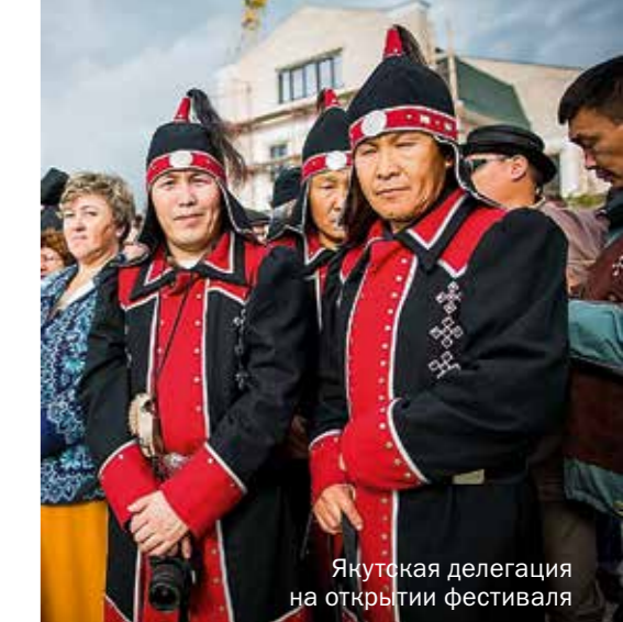
Якутская делегация на открытии фестиваля

сленников, Проспект кузнецов, Площадь оружейников. И везде — сплошной интерактив!