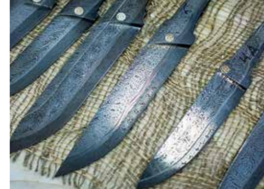
Клинки из мозаичного дамаска, представленные белорусским кузнецом Александром Белым