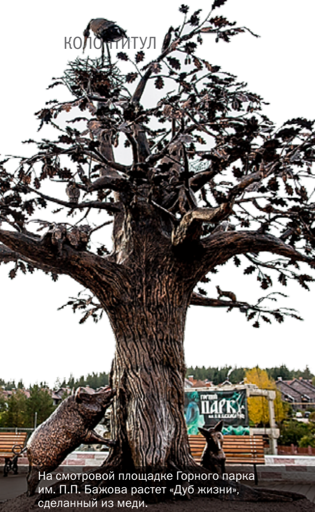
На смотровой площадке Горного парка им. П.П. Бажова растёт «Дуб жизни», сделанный из меди.