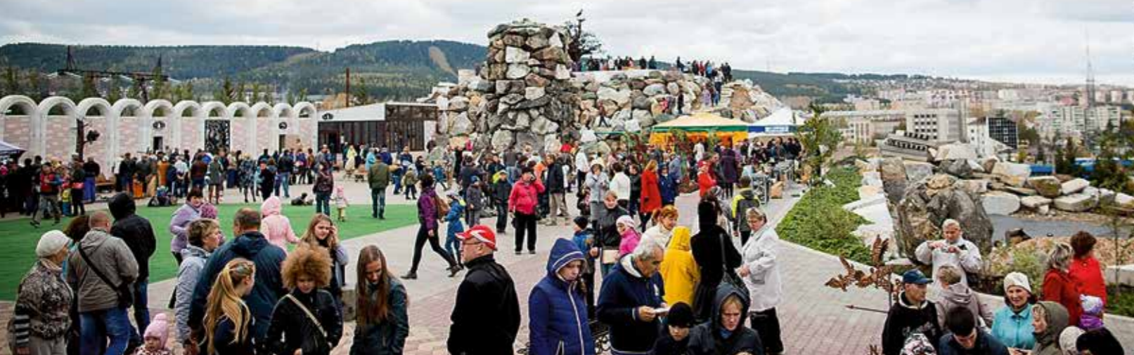
Заметки о V Международном кузнечном фестивале «Кузюки. Город мастеров» в Златоусте

Среди сосен стоит якутская кузница с горном, мехами и печкой для выплавки крицы. Размеренно работают мастера и подмастерья, звучит хомус*. Из печи вылетают искры и языки пламени. А рядом на пеньке сидит мудрый ворон, и порывы ветра шевелят его перья. Можно подумать, что попал за тысячи километров от Москвы в тайгу. А всё гораздо прозаичнее. Так встречает всех входящих V юбилейный Международный кузнечный фестиваль «Кузюки. Город мастеров» в Златоусте. Без преувеличения, это знаковое мероприятие в кузнечной жизни всего Урала.