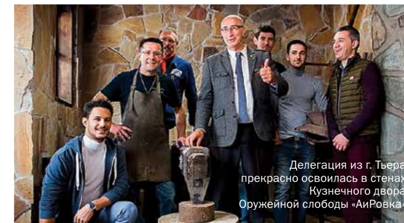
Делегация из г. Тьера прекрасно освоилась в стенах Кузнечного двора Оружейной слободы «АиРовка»

Центральное место на выставке заняла коллекция VIP-гравюр. Это совместный проект «АиР» и продюсера «Злат-ТВ» Майи Авдошиной, в котором уже приняли участие 16 известных людей страны, деятелей культуры, искусства, политиков и спортсменов. VIP-персона рисует эскиз, художники его дорабатывают, сохраняя индивидуальность «звёздного» рисунка. Так рождается уникальная вещь — гравюра по авторскому эскизу. В проекте «VIP-гравюра» участвовали: первая женщина-космонавт В. Терешкова, Герой России В. Шарпатов, чем-