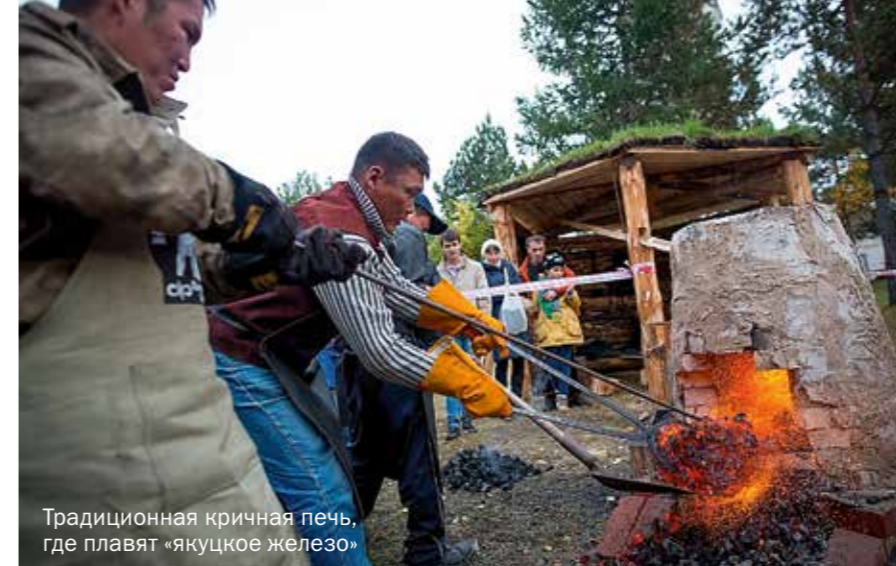
Традиционная кричная печь, где плавят «якуцкое железо»

Любой посетитель «Города мастеров» мог пройти посвящение в кузюки**. Вся территорию разбили на секторы: Слобода реме-