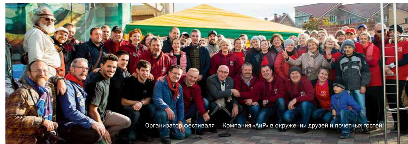
Организатор фестиваля — Компания «АиР» в окружении друзей и почетных гостей